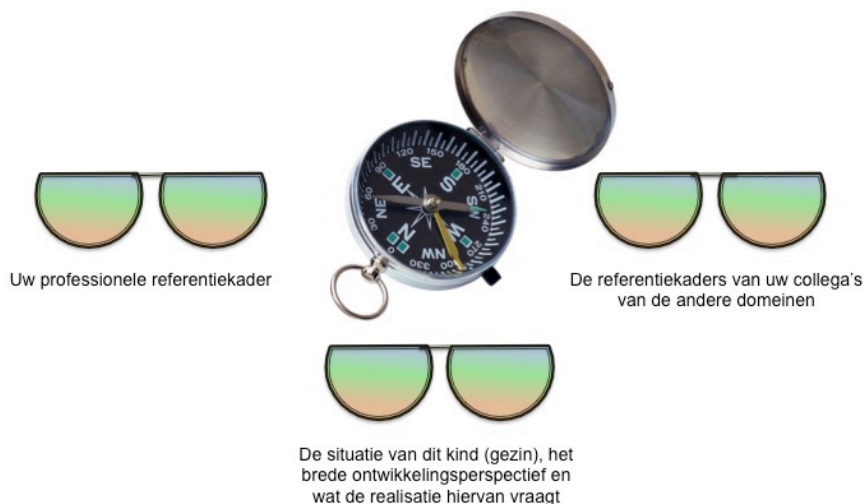
Figuur 2. Kijken en handelen in drie windrichtingen

In de tweede plaats wordt van alle professionals gevraagd om kennis en een goed begrip te hebben van de referentiekaders van de collega's uit de andere domeinen. Vanuit welke kernvisie werken zij? Over welke methoden en instrumenten beschikken zij en welke antwoorden en oplossingen zijn hierdoor mogelijk?